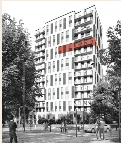
Parque Florestal de Monsanto