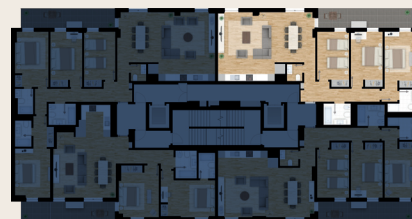
Parque Urbano de Miraflores