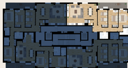
Parque Urbano de Miraflores